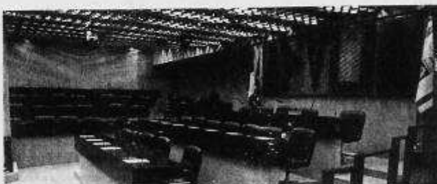
Il Centrodestra vota contro il ddl di esercizio provvisorio